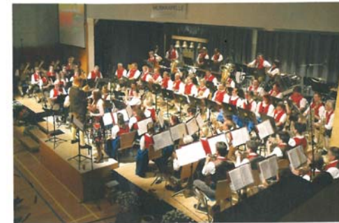
Die MK Tarrenz zählt neben Roppen und der MK Landeck Perjen zu den drei Kapellen Tirols, die heuer über 90 Punkte erreichten.