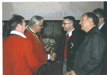
Die MK Landeck Perjen war die einzige Kapelle Tirols, die sich heuer in der Schwierigkeitsstufe D einer Konzertwertung stellte und erreichte großartige 90,0 Punkte.

Die „dynamische Differenzierung“ rangiert mit 8,12 Punkten fast identisch mit dem vorher genannten Kriterium. Das heißt, auch hier ist Aufholbedarf gegeben. Viele Kapellen spielen offensichtlich alles gleich laut. Damit geht viel an Wirkung verloren. Kann man im Bereich Registerbalance wahrscheinlich keine Wunder wirken, so ließe sich in der dynamischen Differenzierung durch gezielte Pro-