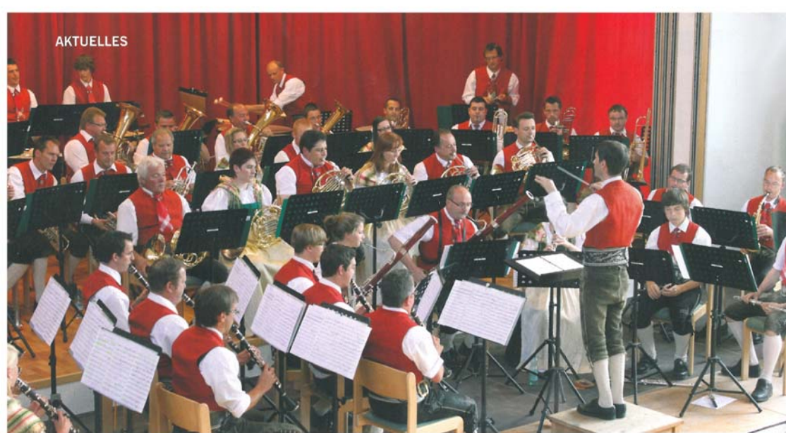
Mit 92,33 Punkten im heurigen Wertungsjahr punktstärkste Kapelle Tirols: Die MK Roppen.